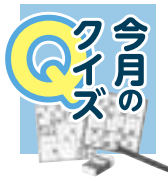
イラスト: 佐伯紀代子さん