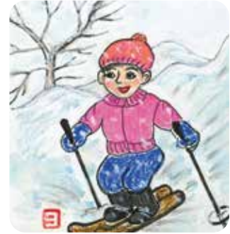
イラスト：三代淑子さん

「ココのババちゃん」主人が急に検査入院になり、入院用品を持って生協病院に行きました。検査中だったのでナースステーション近くで待っているとどの職員さんも頭を下げ挨拶をして通られる姿には感心しました。